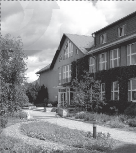
Sitz des sächsischen LFULG